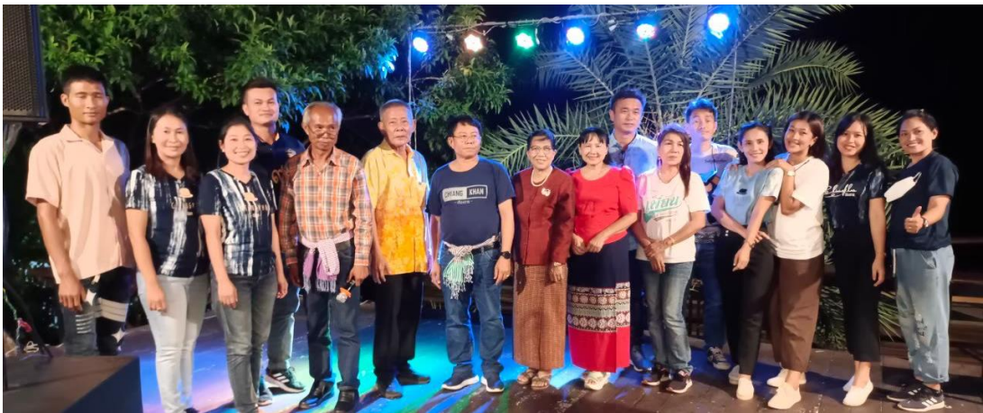
ร่วมกันแสดงความอาลัย กับคุณครูที่สูญเสียญาติ